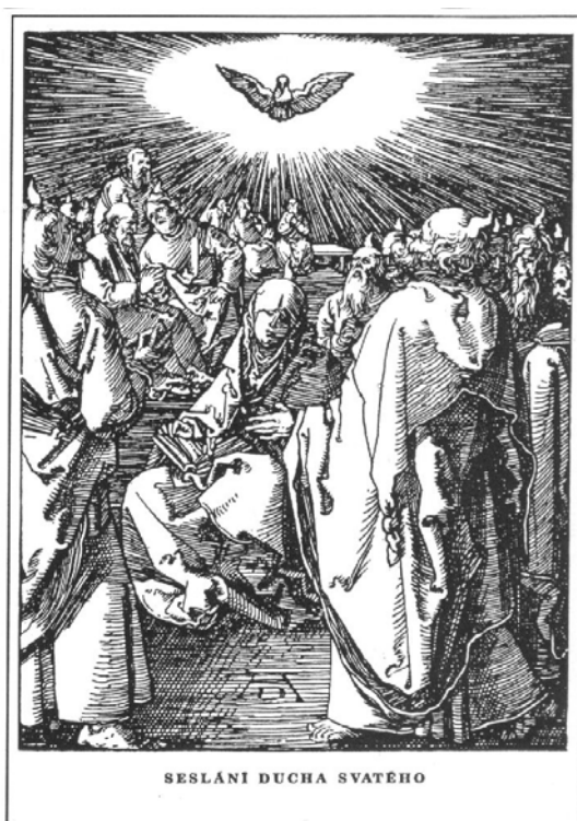
SESLÁNÍ DUCHA SVATEHO

Svatý Duchu, sestup k nám, dej své světlo temnotám, v jasu lásky nech nás žít. Přijď se svými dary zas, otče chudých mezi nás, přijď nám srdce potěšit.